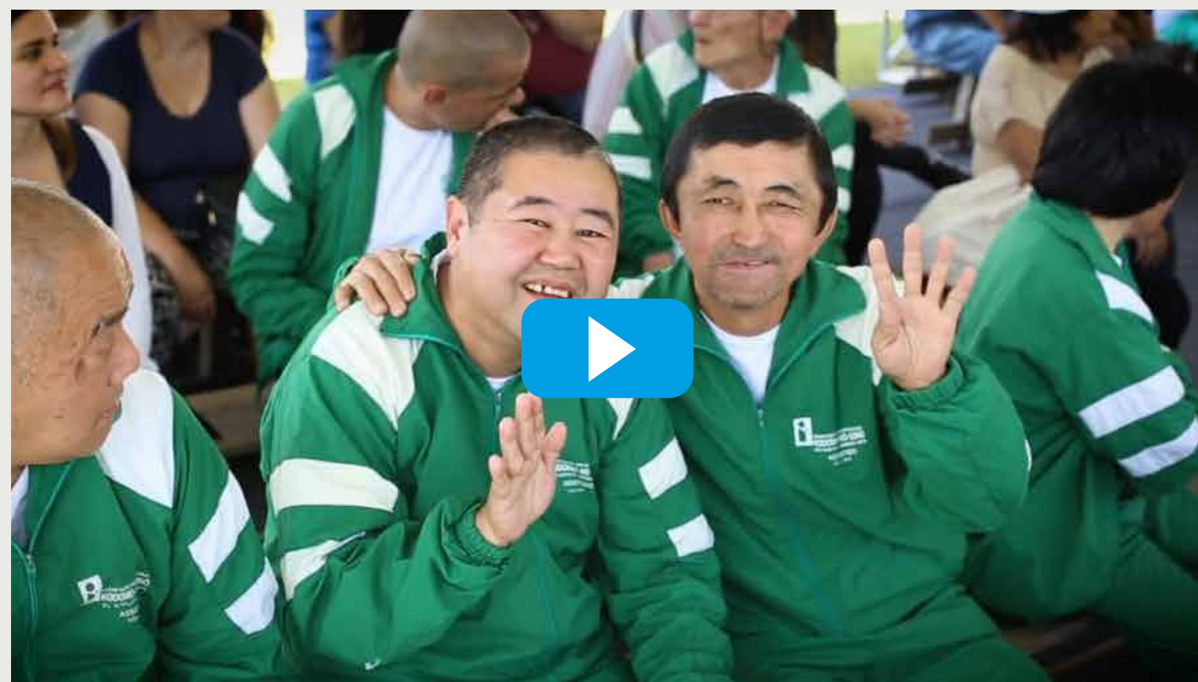
VÍDEO 35º FESTIVAL KODOMO NO SONO

ASSISTA O VÍDEO DAS EDIÇÕES PASSADAS E CONHEÇA O FESTIVAL KODOMO NO SONO. DÊ O PLAY!