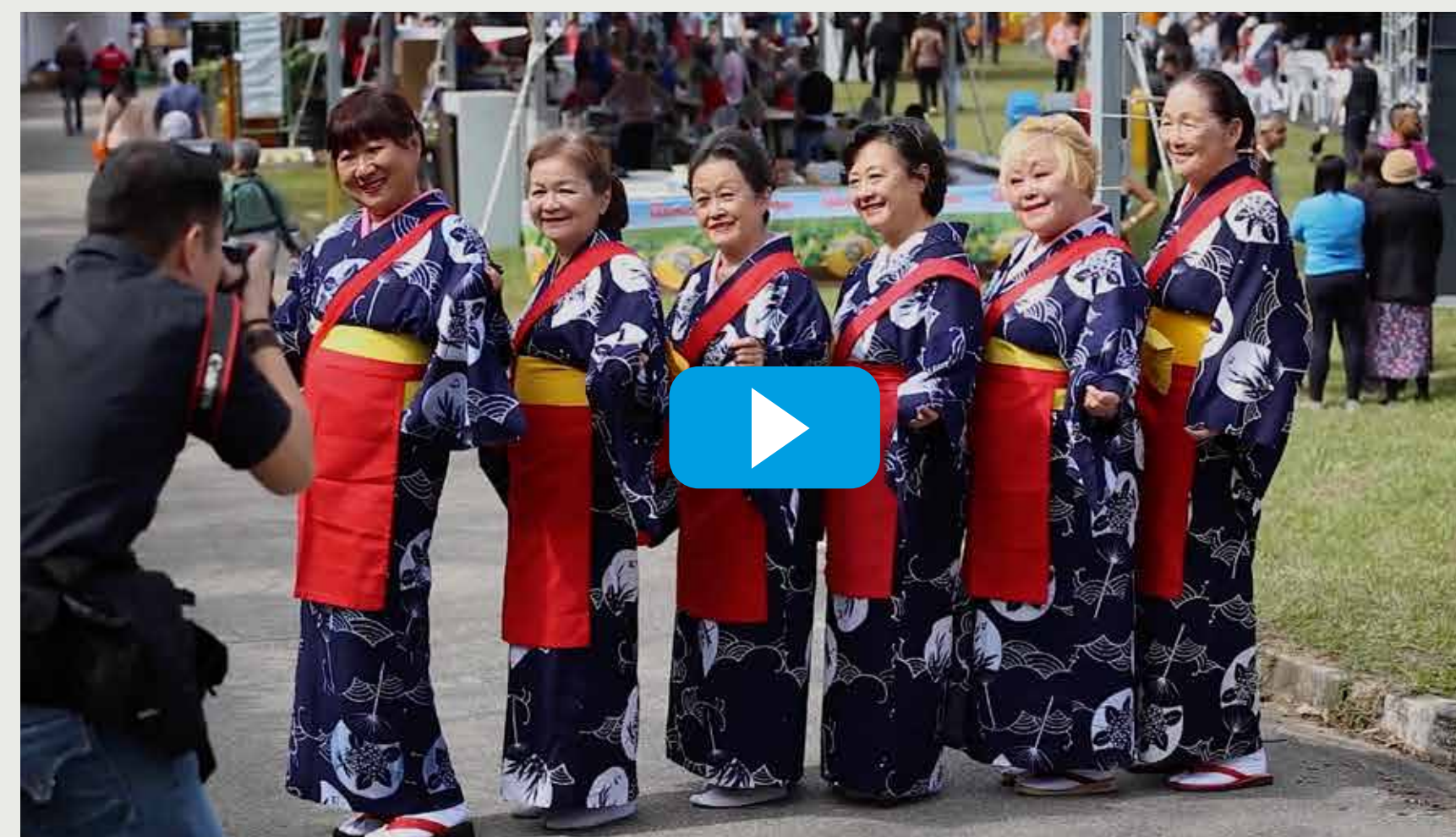
VÍDEO 36º FESTIVAL KODOMO NO SONO